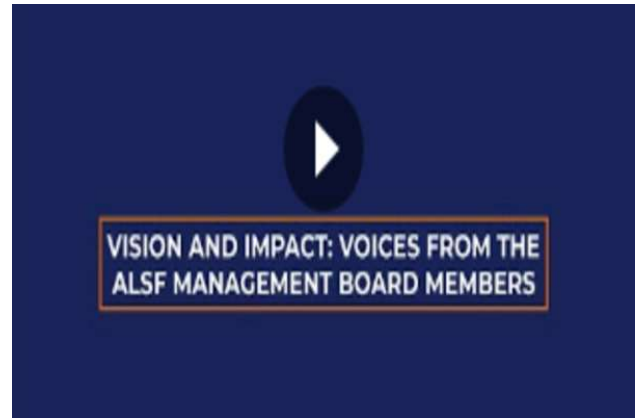
Vision et Impact : Voix des membres du Conseil d'Administration de l'ALSF