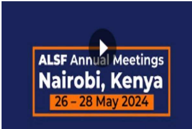
Assemblées Annuelles de l'ALSF Nairobi, Kenya 26 - 28 mai 2024