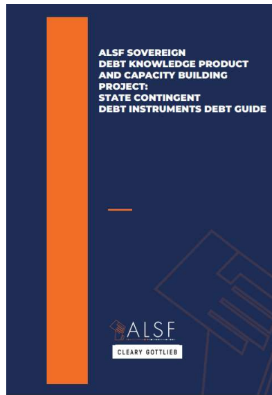
ALSF sovereign debt knowledge product and capacity building project: State contingent debt instruments debt guide